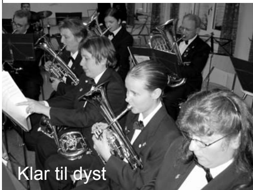
Klar til dyst